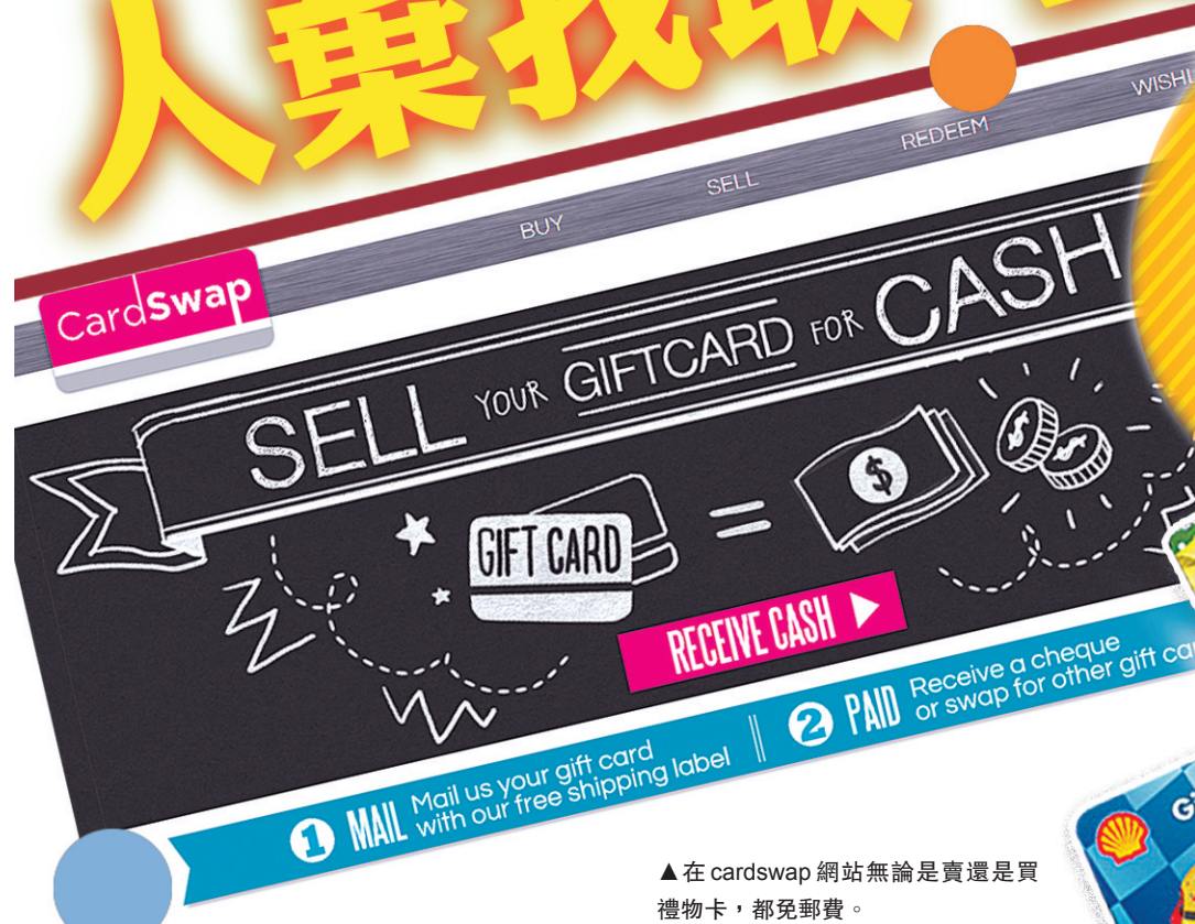
▲在 cardswap 網站無論是賣還是買禮物卡，都免郵費。

聖誕節剛過，大家收禮物怕是收到手軟。在這些琳琅滿目的禮物中，有一部分是禮物卡。要是收到不喜歡、不常光顧商店的禮物卡，你會怎麼辦？硬是買些用不到的商品，還是乾脆將禮物卡放着不用？